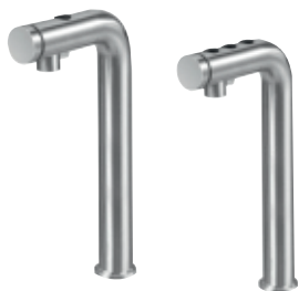
Краны «MIX» (1 и 3 кнопки)