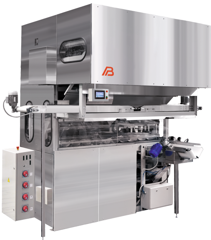
«Бриз плюс Супер».

Предназначены для механизации процесса предварительной расстойки тестовых заготовок хлебобулочных изделий из пшеничной муки после их округления перед операцией окончательного формования.