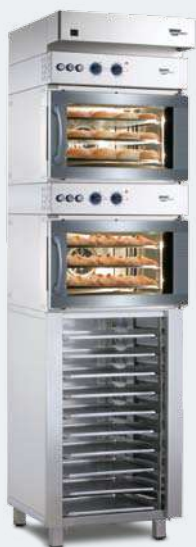
MINIMAT 43 S VARIO