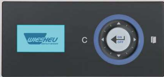
Система управления „Комфорт“