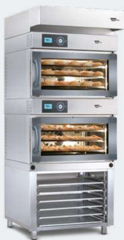
MINIMAT 64 M VARIO