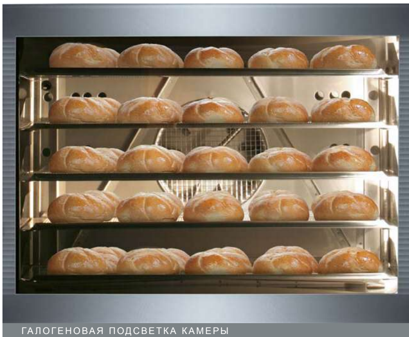
ГАЛОГЕНОВАЯ ПОДСВЕТКА КАМЕРЫ