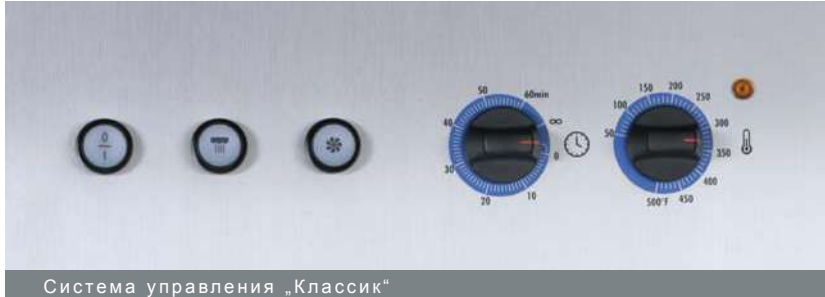
Система управления „Классик“