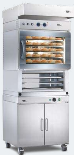
MINIMAT 64 L

Промежуточный стеллаж Расстойный шкаф М Вытяжной козырек