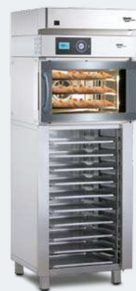
MINIMAT 43 S

Промежуточный стеллаж Расстойный шкаф М Вытяжной козырек