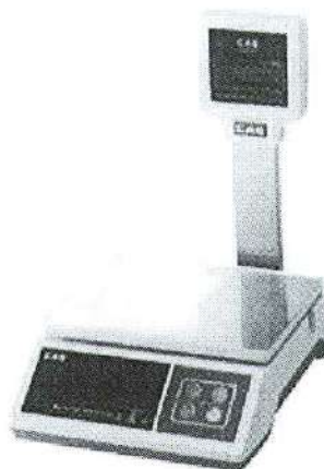
SW (модификация со стойкой)